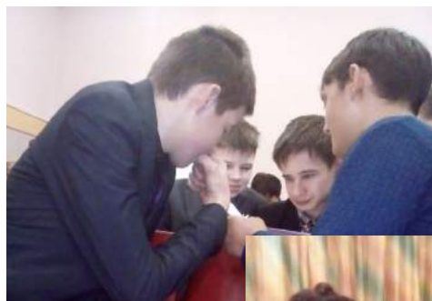
Мозговой штурм по истории журналистики