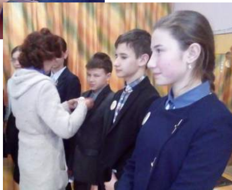
Вручение значков юных журналистов